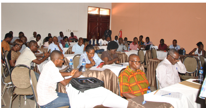
Abo ni abamenyeshamakuru bari bitavye ico kiganiro