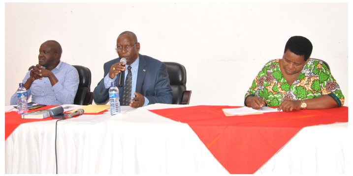
Abo ni Umukuru w'umurwi CVR akikijwe n'icegera c'iwe n'umunyamabanga w'umurwi CVR

azobangikanya no kuba umwibutsamana mu gisirikare.